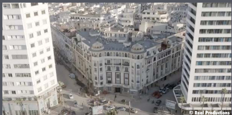
Au centre, immeuble de style art déco à Casablanca