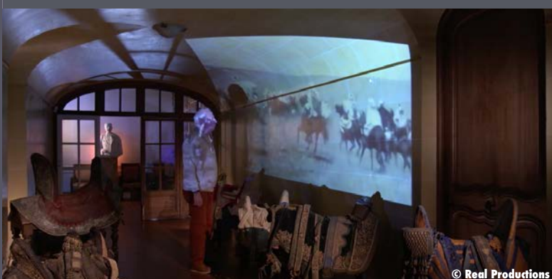
Au Château de Thorey-Lyautey, musée de la fondation Lyautey