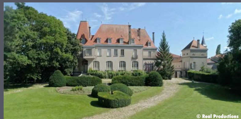
Château de Thorey-Lyautey