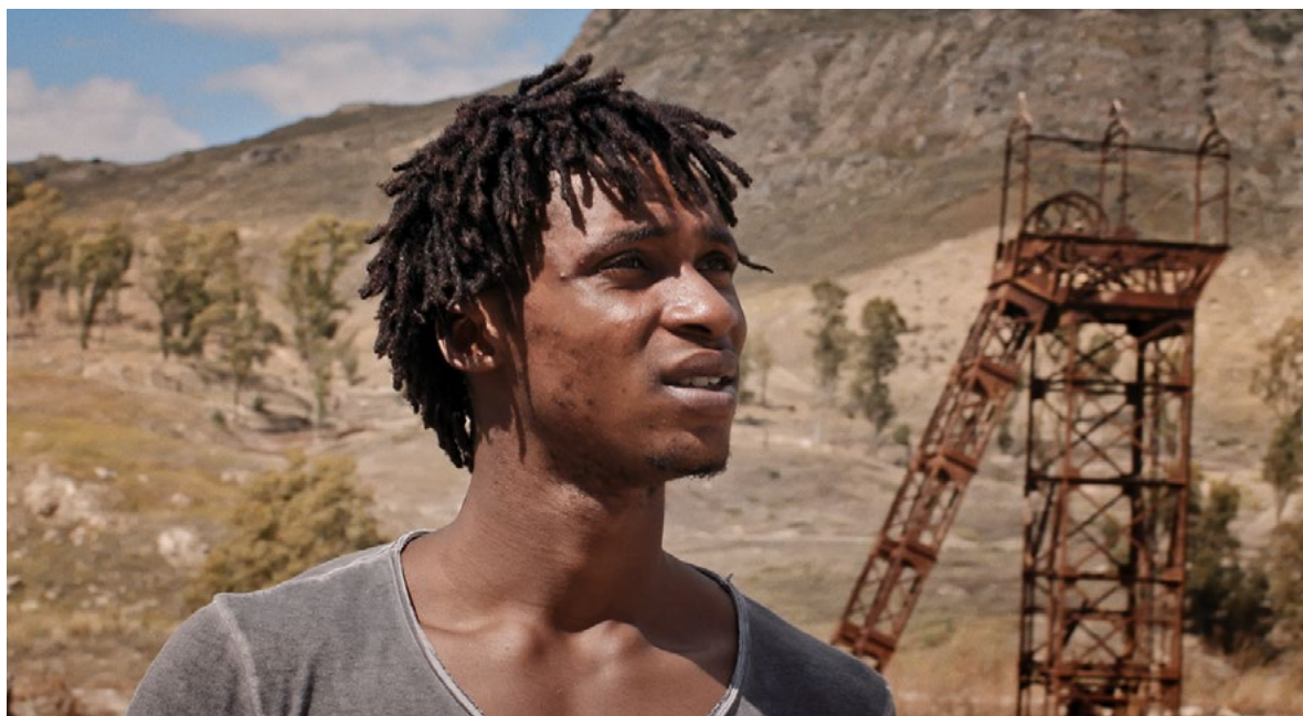
Il mio corpo

J'étais fasciné depuis toujours par la Sicile et je me suis rendu à Catane où j'ai réalisé en 2013 le premier film de la trilogie, 'A iucata . Je suis tombé amoureux de l'île ainsi que de sa face cachée. Dans chacun de mes films, je m'intéresse à des personnages marginaux, invisibles aux yeux de la société. J'ai voulu montrer ce monde de laissés pour compte. Pendant que je tournais mon premier film, j'ai été témoin de problèmes liés aux flux migratoires. Dans tous mes documentaires, je me pose la question du point de vue. Comment regarder la réalité de l'immigration de manière inédite ? Je pense qu'à l'époque je n'étais pas assez mur pour parler de ce sujet. Il m'a fallu cheminer intérieurement et artistiquement. Dans mon